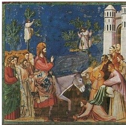
Jesus zieht in Jerusalem ein Giotto di Bondone (1267-1337)

Mit „Hosiannarufen“ wird Jesus beim Einzug nach Jerusalem begrüßt. Ihm wird der Weg bereitet mit Zweigen und Kleidern „Seht unser König kommt! Hosianna!“ Die Menschen begrüßen Jesus wie einen König. Doch er sieht nicht aus wie ein weltlicher König. Er reitet nach Jerusalem hinein auf einem Esel. Er ist der König des Friedens. Auch wir möchten Jesus, unseren König des Friedens willkommen heißen. Er begegnet uns jeden Tag. Oft sind wir uns dessen nicht bewusst. Denn er begegnet uns meist anders als erwartet. Das macht uns auch Palmsonntag deutlich. Jesus kommt nicht auf einem prachtvollen Pferd und in Königskleidern zu uns geritten, sondern er begegnet uns viel bescheidener. Auf einem kleinen Lasttier, welches oft auch seinen eigenen Kopf hat