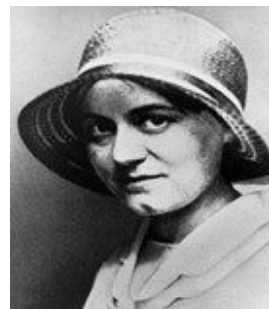
Edith Stein (um 1920) ökumenisches Heiligenlexikon

Die Andacht finden Sie auf unserer Homepage unter "Gebet und Gottesdienst zuhause".