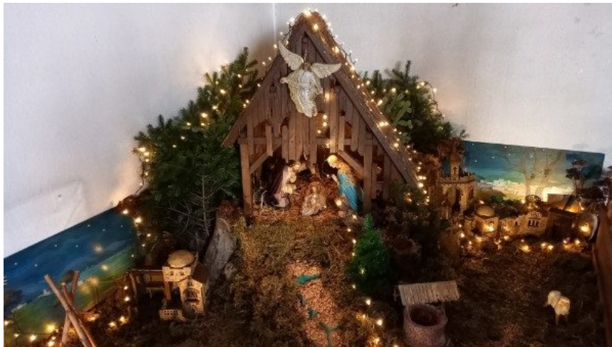
Krippe in St. Michael, Dannstadt