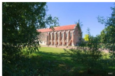
Abbaye de Cîteaux

Fahrt der Pfarrei Heiliger Sebastian – Dannstadt-Schauernheim 7 Tage vom 26. Mai – 01. Juni 2023