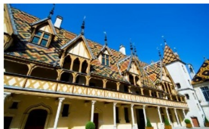
Beaune – Hotel Dieu

Herzlich Willkommen! Steigen Sie ein und nehmen Platz auf Ihrem reservierten Sitzplatz! 1. Tag: Reiseroute führt uns über Kaiserslautern – Saarbrücken nach Metz, Hauptstadt des Departements Moselle, eine der sehenswertesten Städte Europas. Wir interessieren uns vor allem für die gotische Kathedrale St. Etienne, wegen ihrer gewaltigen Fenster „Laterne Gottes“ genannt. Dabei dürfen wir die über 6500 qm großen Fensterflächen von Marc Chagall bestaunen. Nach etwas Freizeit und individueller Mittagspause fahren wir dann weiter über Troyes nach Auxerre, in der Region Bourgogne-Franche-Comté gelegen. Gemeinsames Abendessen – Übernachtung.