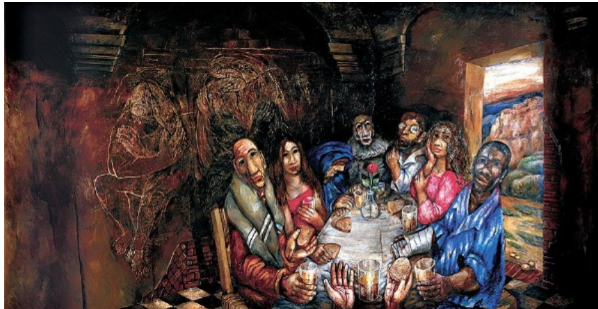
Sieger Köder, Das Mahl mit den Sündern

(aus: Schott-Messbuch: Hochfest des Leibes und Blutes Christi)