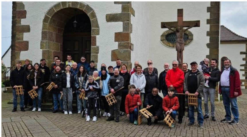
Gären in Rödersheim