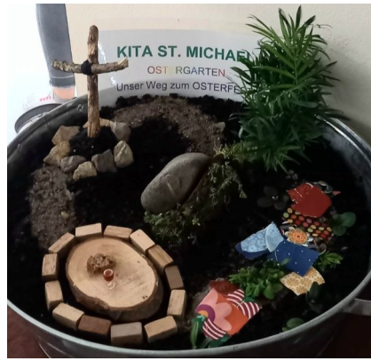
Stellvertretend für die schöne Ostervorbereitung in unseren vier Kindertagesstätten ein Bild eines Ostergartens