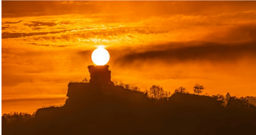
Drachenfels im Sonnenuntergang

Liebe Pfarreimitglieder, liebe Leserinnen und Leser unseres Newsletters,