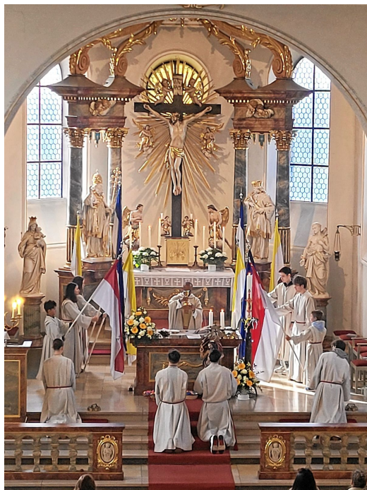
Jeweils 14 Messdiener/-innen dienten 3x im Triduum und am Ostersonntag. Dazu anerkennend der Obermessdiener: Ihr seid wirklich die besten Messdienerinnen und Messdiener, die sich Rödersheim wünschen kann!"