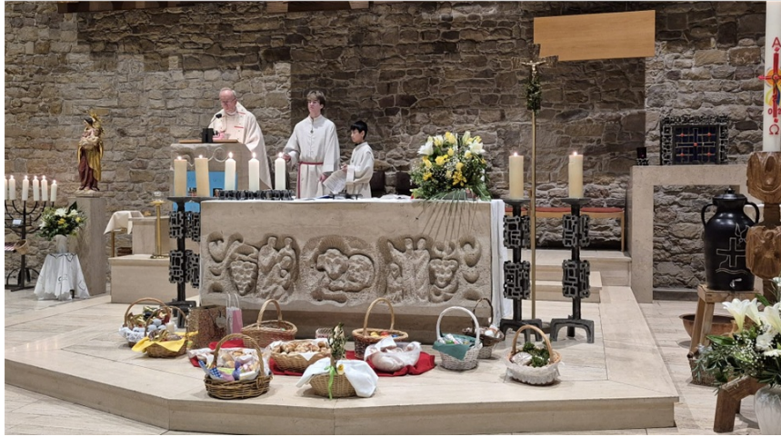
Obenstehende zwei Bilder: Osternacht in Hochdorf