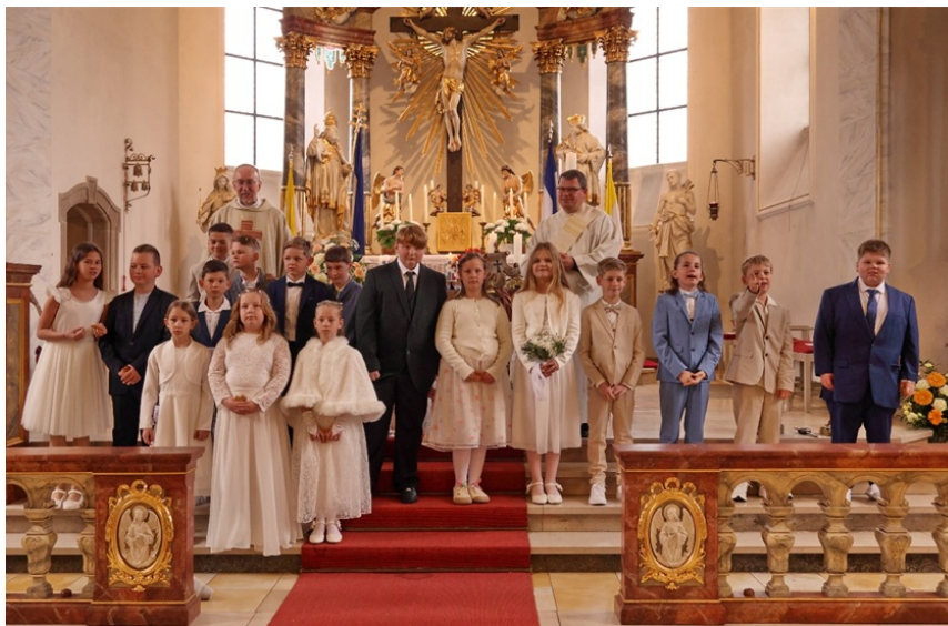
Obenstehende zwei Bilder von Hans Schrimpf: Erstkommunionfeier in Rödersheim