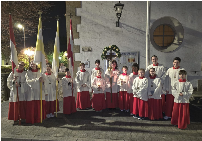
15 Messdiener/-innen in der Osternacht in Mutterstadt

Osterfeiern: Bildeindrücke von einigen unserer Kirchen