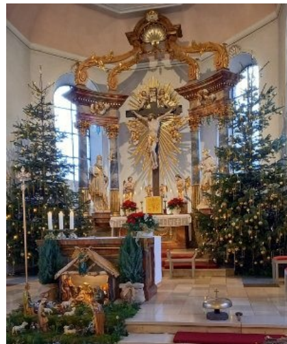
Kirche St. Leo, Rödersheim

St. Leo, Rödersheim 20.01.2021, 12 - 18 Uhr zur Anbetung anlässlich des Sebastianusfestes, ansonsten nach telefonischer Vereinbarung