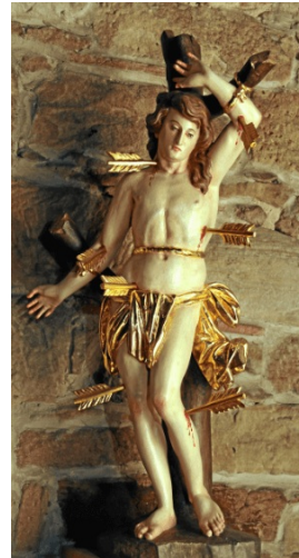
Sebastianusstatue St. Peter, Hochdorf

Trotz Verfolgung, Gefangennahme und Folter hat der Hl. Sebastian die innere Kraft gefunden, seinem christlichen Glauben bis in den Tod hinein treu zu bleiben. Dieses „Übermaß der Kraft“, auch in schweren Lebenszeiten den Glauben zu bewahren und zu bezeugen, kommt von Gott, der will, dass wir nicht verzagen, sondern immer wieder neuen Lebensmut schöpfen.