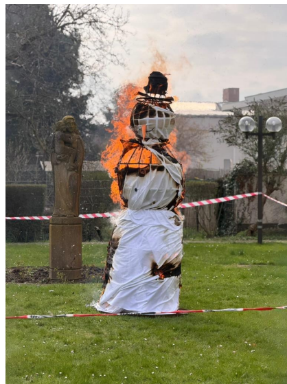
Bild aus dem Gottesdienst in Mutterstadt