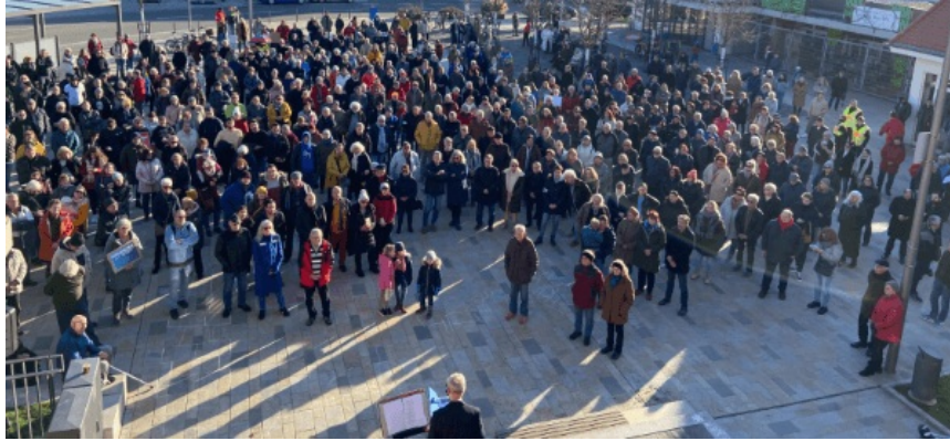
"Mahnwache. Nie wieder! Aufstehen für die Demokratie", 28. Januar 2024 in Mutterstadt

Liebe Gemeinde, liebe Mitchristen, liebe Leserinnen und Leser!