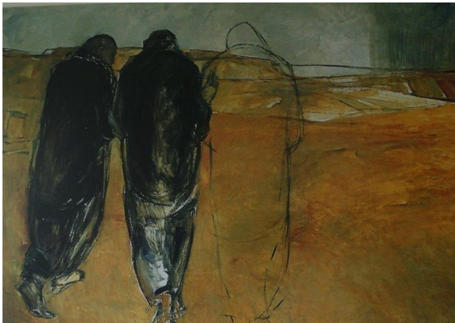
Emmausbild - Ensiedlerin bei St. Gallen

Sie können nicht alles begreifen, aber ihr Herz brennt, sie laden den Fremden ein, sie teilen miteinander nicht nur das Leben, sondern auch Brot und Wein. Und da werden ihre Augen aufgetan. Sie erkennen IHN im Brotbrechen, im gemeinsamen Mahl.