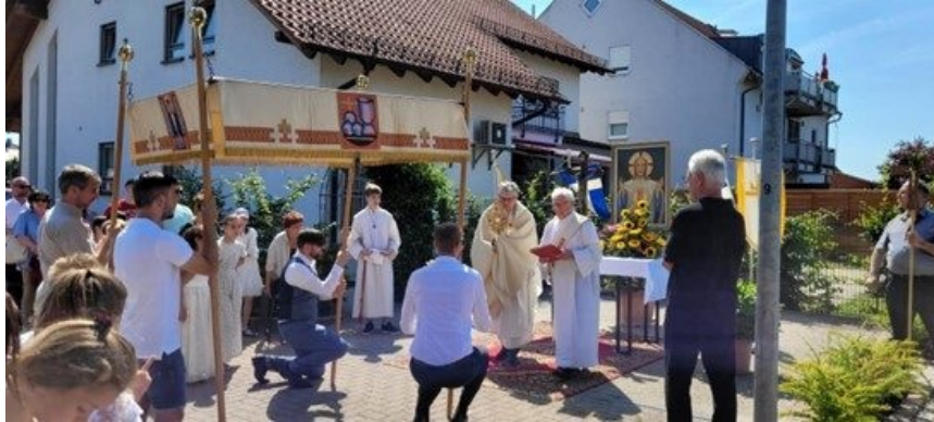
Fronleichnam 2022 in unserer Pfarrei

Liebe Pfarreimitglieder, liebe Leserinnen und Leser unseres Newsletters,