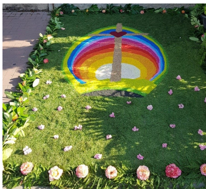
Fronleichnam 2022 in unserer Pfarrei

„Wenn uns Christus aber an den Altar führt und seinen Leib zu essen gibt, dann wandelt er uns ganz und gar um und versetzt uns in seinen eigenen Zustand. Der Lehm ist nicht mehr Lehm, wenn er das königliche Bild angenommen hat, vielmehr ist er selbst schon Leib des Königs. Etwas Seligeres lässt sich nicht denken... Welch Gegenwärtiges könnte sich behaupten, welch Abwesendes vermöchte etwas hinzuzufügen, wenn Christus so wirklich bei uns ist und uns vollkommen durchdringt, wenn er das ganze Innere in Besitz nimmt, wenn er auch um uns ist? Denn nicht nur an dem Seinigen, sondern die Sonnenscheibe selbst halten wir in unseren Seelen. ... Das Sterbliche wird verschlungen vom Leben, also lebe nicht mehr ich, vielmehr Christus lebt in mir. ... Christi Geist mischt sich mit unserem Geist, sein Wille mit unserem Willen, Leib verschmilzt mit Leib und Blut mit Blut. ...Doch ist auch dieses Sakrament nicht wirksam, wenn man nicht dazu das heilige Mahl auch wirklich genießt.“