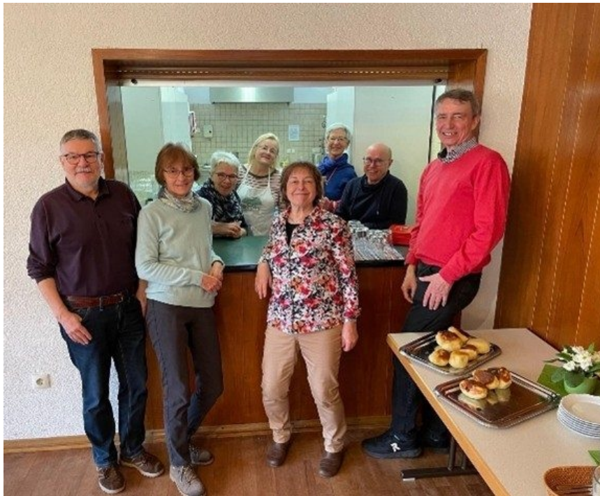
Bild der Helfer des anschließendem Fastenessens in Mutterstadt