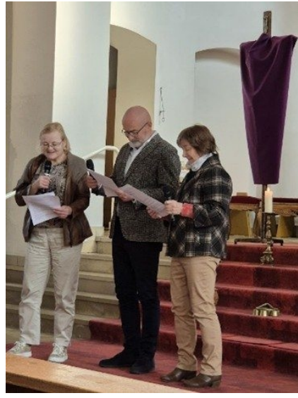
Bilder aus dem Gottesdienst in Mutterstadt