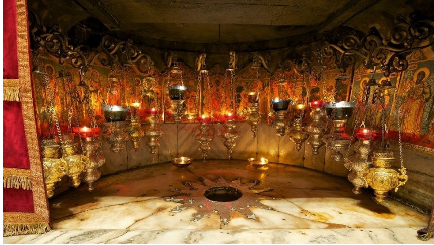
Der Stern markiert die traditionelle Geburtsstelle Jesu Christi