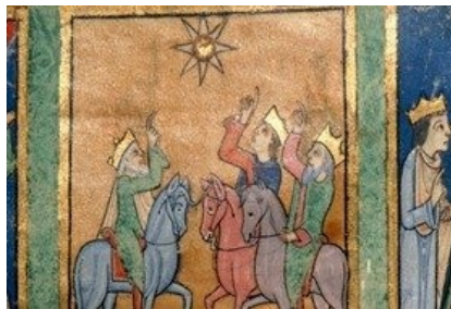
Die drei Weisen folgen dem Stern von Betlehem, Buchmalerei aus dem 12. Jahrhundert

„Als Jesus zur Zeit des Königs Herodes in Betlehem in Judäa geboren worden war, kamen Sterndeuter aus dem Osten nach Jerusalem und fragten: Wo ist der neugeborene König der Juden?“