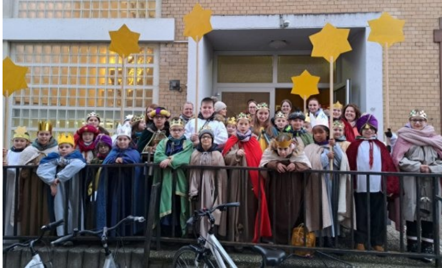
Sternsinger 2023 in Mutterstadt

Liebe Gemeinde, liebe Mitchristen, liebe Leserinnen und Leser!