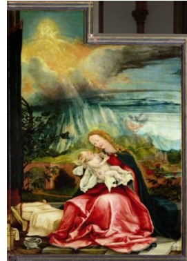
Die Geburt Christi, Isenheimer Altar, Matthias Grünewald um 1512

Weihnachten hat vor allem etwas mit Neuanfang zu tun, mit unseren eigenen kleinen Schritten heraus aus der Erstarrung, hin zum Licht.