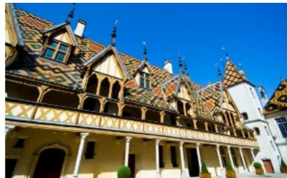
Beaune – Hotel Dieu

Herzlich Willkommen! Steigen Sie ein und nehmen Platz auf Ihrem reservierten Sitzplatz!