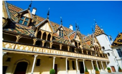
Beaune – Hotel Dieu

Herzlich Willkommen! Steigen Sie ein und nehmen Platz auf Ihrem reservierten Sitzplatz! 1. Tag: Reiseroute führt uns über Kaiserslautern – Saarbrücken nach Metz, Hauptstadt des Departements Moselle, eine der sehenswertesten Städte Europas. Wir interessieren uns vor allem für die gotische Kathedrale St. Etienne, wegen ihrer gewaltigen Fenster „Laterne Gottes“ genannt. Dabei dürfen wir die über 6500 qm großen Fensterflächen von Marc Chagall bestaunen. Nach etwas Freizeit und individueller Mittagspause fahren wir dann weiter über Troyes nach Auxerre, in der Region Bourgogne-Franche-Comté gelegen. Gemeinsames Abendessen – Übernachtung.