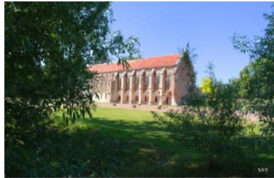
Abbaye de Cîteaux

Fahrt der Pfarrei Heiliger Sebastian – Dannstadt-Schauernheim 7 Tage vom 26. Mai – 01. Juni 2023