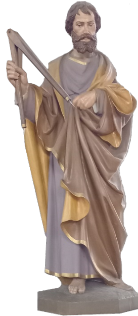
Hl. Josef in St. Michael, Dannstadt

Seit mehr als vierzig Jahren betet unser Papst Franziskus jeden Tag folgendes wunderbares Gebet um die Fürsprache des heiligen Josef.