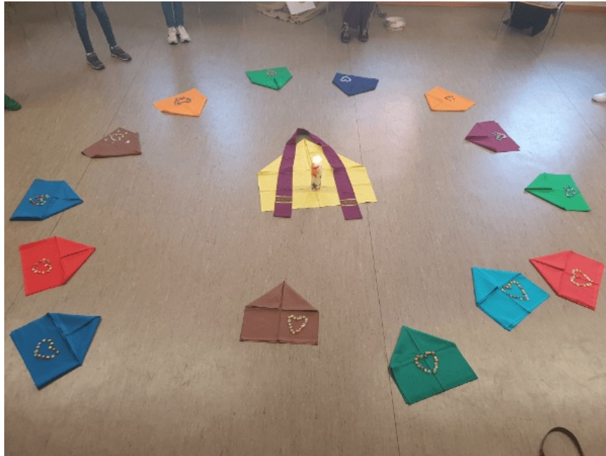
Beichtvorbereitung der Kommunionkinder

Liebe Pfarreimitglieder, liebe Leserinnen und Leser unseres Newsletters,