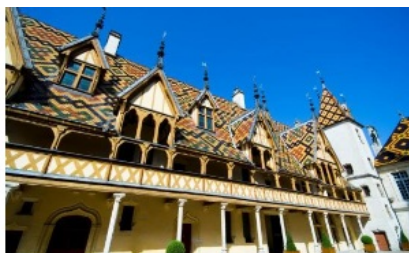
Beaune – Hotel Dieu

Herzlich Willkommen! Steigen Sie ein und nehmen Platz auf Ihrem reservierten Sitzplatz!