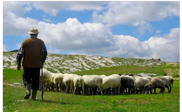
Ein Hirte mit seinen Schafen

Du deckst mir den Tisch vor den Augen meiner Feinde. Du salbst mein Haupt mit Öl, du füllst mir reichlich den Becher. Lauter Güte und Huld werden mir folgen mein Leben lang und im Haus des Herrn darf ich wohnen für lange Zeit.