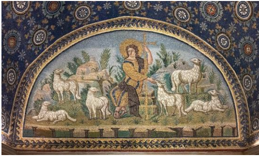
Der gute Hirte, Mosaik im Mausoleum der Kaiserin Galla Placidia

hereinkommt und nicht heimlich irgendwo anders einsteigt. Dazu sagt uns Pfarrer Jörg Sieger in einer Predigt: „Blind zu vertrauen und blind zu gehorchen kann fatale Folgen haben. Gerade in Deutschland haben wir nur allzu deutlich und allzu schmerzhaft erfahren müs-