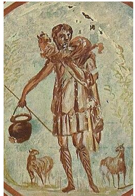
Jesus als guter Hirte Fresko 3. Jahrhundert in der Calixtus-Katakombe in Rom

In jener Zeit sprach Jesus: Amen, Amen, das sage ich euch: Wer in den Schafstall nicht durch die Tür hineingeht, sondern anderswo einsteigt, der ist ein Dieb und ein Räuber. Wer aber durch die Tür hineingeht, ist der Hirt der Schafe. Ihm öffnet der Türhüter, und die Schafe hören auf seine Stimme; er ruft die Schafe, die ihm gehören, einzeln beim Namen und führt sie hinaus. Wenn er alle seine Schafe hinausgetrieben hat, geht er ihnen voraus, und die Schafe folgen ihm; denn sie kennen seine Stimme. Einem Fremden aber werden sie nicht folgen, sondern sie werden vor ihm fliehen, weil sie die Stimme des Fremden nicht kennen. Dieses Gleichnis erzählte Jesus; aber sie verstanden nicht den Sinn dessen, was er ihnen gesagt hatte. Weiter sagte Jesus zu ihnen: Amen, Amen, ich sage euch: Ich bin die Tür zu den Schafen. Alle, die vor mir kamen, sind Diebe und Räuber; aber die Schafe haben nicht auf sie gehört. Ich bin die Tür; wer durch mich hineingeht, wird gerettet werden; er wird ein und aus gehen und Weide finden. Der Dieb kommt nur, um zu stehlen, zu schlachten und zu vernichten; ich bin gekommen, damit sie das Leben haben und es in Fülle haben. Evangelium unseres Herrn Jesus Christus.