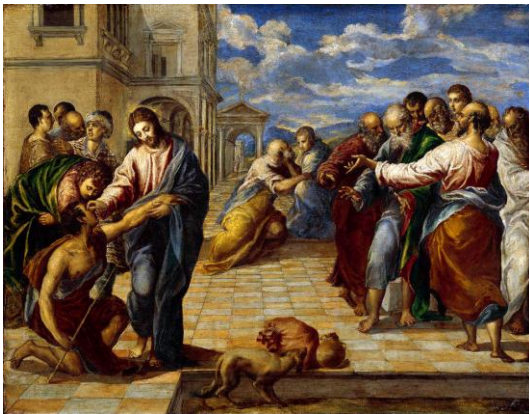
Heilung des Blindgeborenen El Greco 1570