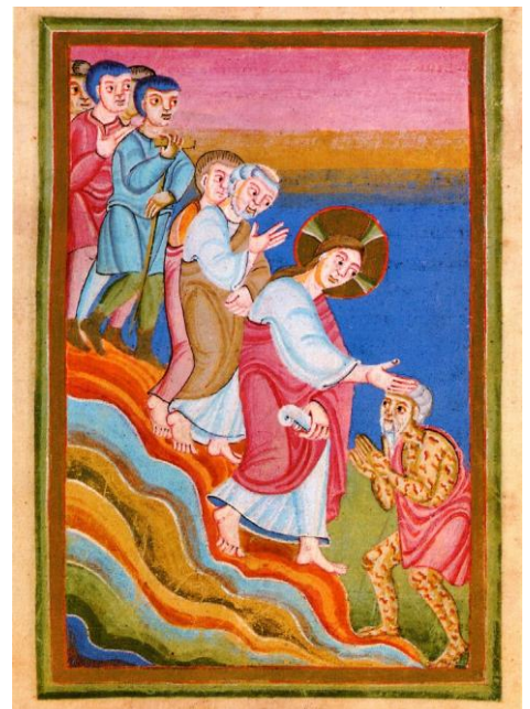
Jesus heilt alle Kranken auch Aussätzige aus dem Evangeliar von Echternach um 1040

Bei dem Taubstummen, von dem Markus berichtet, ist es ähnlich. Um diesen kranken Mann zu heilen begibt sich Jesus in das Gebiet der Dekapolis, ein heidnisches Gebiet. Er verstößt damit gegen die herkömmlichen Reinheitsvorschriften, denn durch die Berührung eines Heiden wird er nach jüdischem Recht unrein. Auch daran stößt sich Jesus nicht. Das Gesetz steht für ihn nicht über dem Mensch. Und so sieht Jesus seine Aufgabe: Er ist da um den Bedürftigen zu helfen. Die Beiden, denen Jesus in ihrer jeweiligen Situation hilft, werden