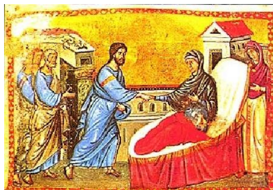
Jesus heilt die Schwiegermutter des Petrus Darstellung aus einem Evangeliar vom Berg Athos, 13. Jahrhundert

So bitten wir durch Christus, unseren Bruder und Herrn