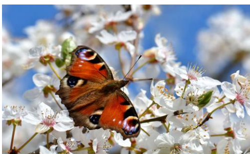
auch die Natur erwacht zu neuem Leben

Wer kann die Last, die uns am Leben hindert aus dem Weg räumen? Wer nimmt die Steine aus den Herzen der Menschen, dass sie miteinander das Leben gestalten. In seiner Auferstehung ist mir die Last genommen, dass mein Leben sinnlos sein könnte. Durch die österliche Erfahrung kann ich neu leben in der Freiheit der Kinder Gottes. Die Grenzen dieser Welt und meine eigenen Grenzen sind in seiner Auferstehung ein für alle Mal überwunden. Der Herr ist auferstanden. Halleluja! (Reinhard Röhner)