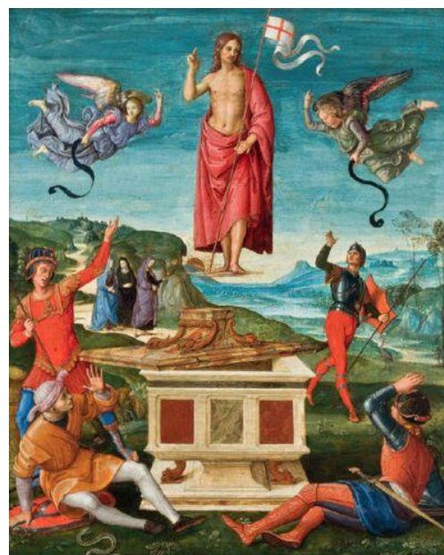
Auferstehung Jesu Mittelbild einer Holzpredella von Raffael Sanzio 1499 – 1502

Herr Jesus Christus, du Licht und Freude des Lebens. In dieser österlichen Zeit schenkst du uns mehr, als wir zu hoffen wagen. Dir tragen wir unsere Bitten vor: